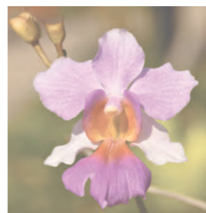
白内障患者的视觉