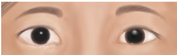
插图: 眼睑边缘下垂的皮肤

眼睛往往是首先引起人们注意的面部器官,对形成美丽、具有吸引力的面部是非常重要的。随着时间的推移,年龄老化会引起上、下眼睑下垂、松弛或形成眼袋。