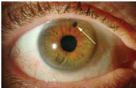
周边虹膜切开术激光后

这种紧急情况需要立即就医，您的眼科医生也许会建议您马上进行激光周边虹膜切开术(Laser Peripheral Iridotomy, 简称 LPI)。